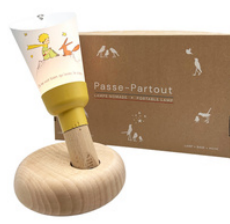
Kleiner Prinz und Fuchs