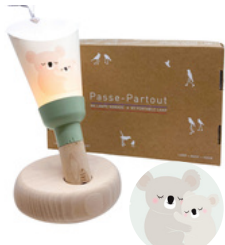
Baby Love Koalas