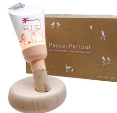
Katze Miou Miou