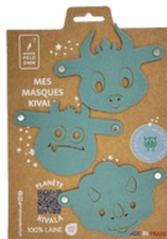
Nicht einmal Angst